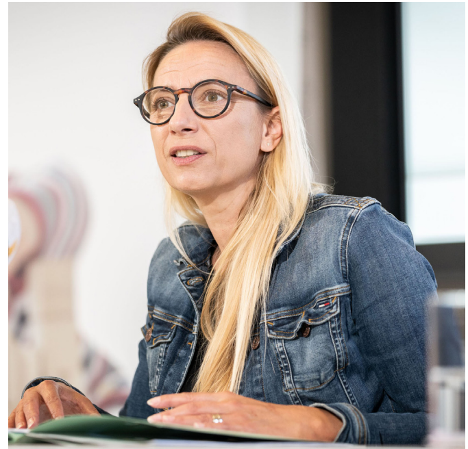
Gesundheitslandesrätin Juliane Bogner-Strauß begrüßt das umfassende Reformpaket der Bundesregierung.

Maßnahmen für Pflegebedürftige und pflegende Angehörige Pflegende Angehörige wer-